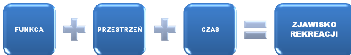
Rys. 1 Czynniki kształtujące zjawisko rekreacji

Rekreacja jest integralnym elementem życia człowieka i zagospodarowania przestrzeni. Ponieważ czynniki kształtujące to zjawisko podlegają przemianom wraz z rozwojem cywilizacyjnym, następują zmiany w formach rekreacji. Formy te zależą bowiem nie tylko od indywidualnych preferencji człowieka, ale również od sytuacji społeczno-gospodarczej i postępu naukowo-technicznego (rys. 2).